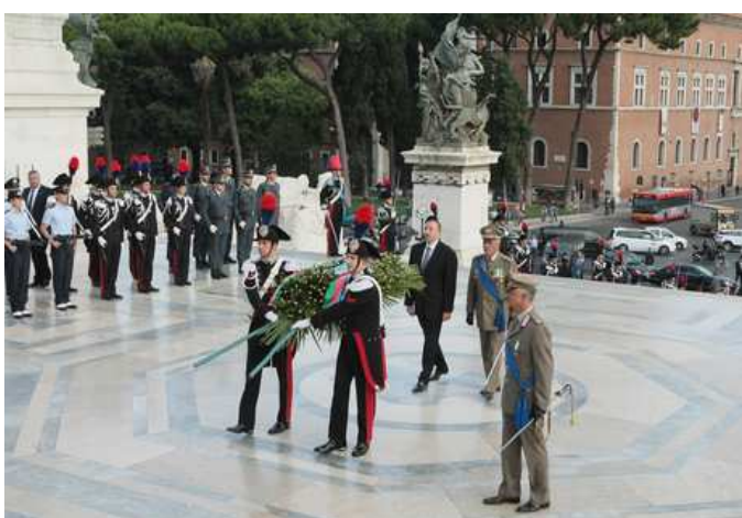
Presidente Aliyev al Milite Ignoto- Altare della Patria

Il Presidente della Repubblica dell'Azerbaijano, arrivato a Roma, si è recato al monumento del Milite Ignoto, presso l'Altare della Patria che, dal momento in cui accolse le spoglie del soldato ignoto italiano caduto in guerra durante la Prima Guerra Mondiale, divenne un'opera architettonica volta a celebrare l'Italia Unita e la sua libertà. Aliyev ha poi fatto visita al monumento del celebre poeta e scrittore azerbaijano Nizami Ganjavi, situato nel parco di Villa Borghese, che fu costruito sotto l'ordine presidenziale "On celebration of the 870th anniversary of great Azerbaijani poet and thinker Nizami Ganjavi" del 23 Dicembre 2011. La scultura, realizzata con il supporto della Fondazione Heydar Aliyev, è stata inaugurata ad Aprile 2012.