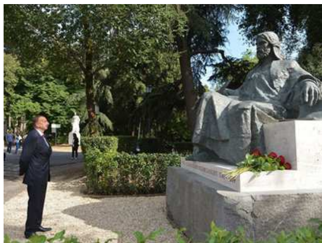
Presidente Aliyev al monumento di Nizami Ganjavi