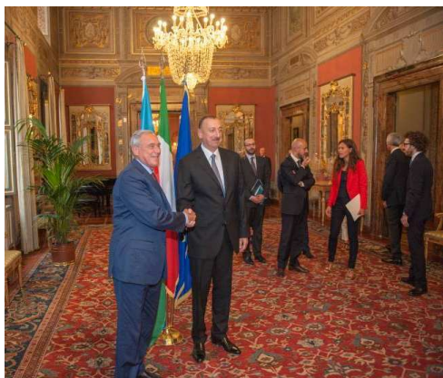
Incontro con il Senatore Pietro Grasso

Durante il suo soggiorno in Italia, il Presidente della Repubblica dell'Azerbaijano ha inoltre fatto visita al Presidente del Senato Pietro Grasso ed è stato accolto dal Direttore Generale della FAO – Food and Agriculture Organization of the United Nations-, José da Silva.